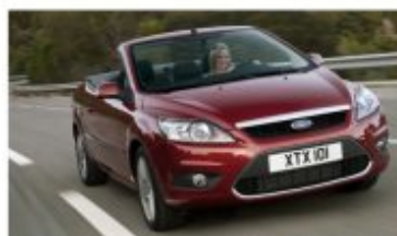
Ford Focus Coupé-Cabriolet

Poniżej przedstawiamy kilka najnowszych modeli marki Ford. Nowoczesne rozwiązania, jakie oferują zapewnią nam i naszym bliskim maksymalny komfort, bezpieczeństwo i niezapomniane wrażenia.