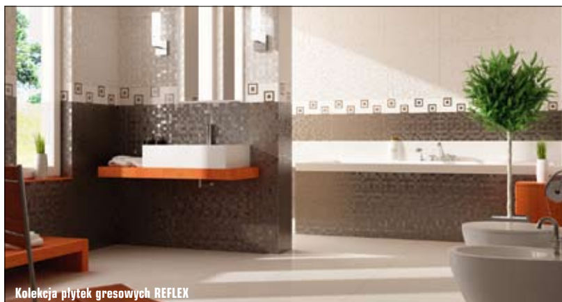
Kolekcja płytek gresowych REFLEX