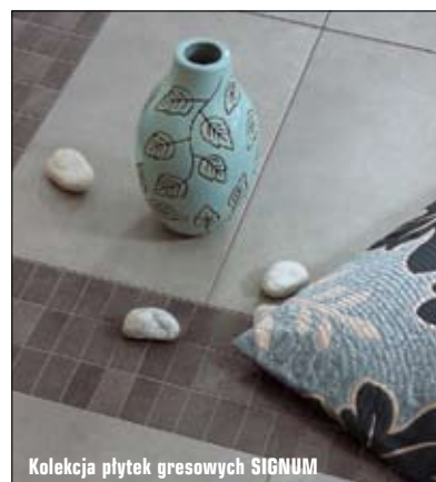
Kolekcja płytek gresowych SIGNUM

Mocowanie: za pomocą kleju do płytek gresowych, na fasadach mocowane do metalowej lub aluminiowej konstrukcji nośnej w systemie widocznym albo niewidocznym